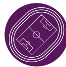
Zona Roxa Em volta do campo