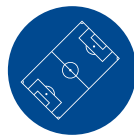
Zona Azul Campo de Jogo