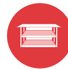
Zona Vermelha Área Operacional