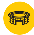
Zona Amarela Área Externa